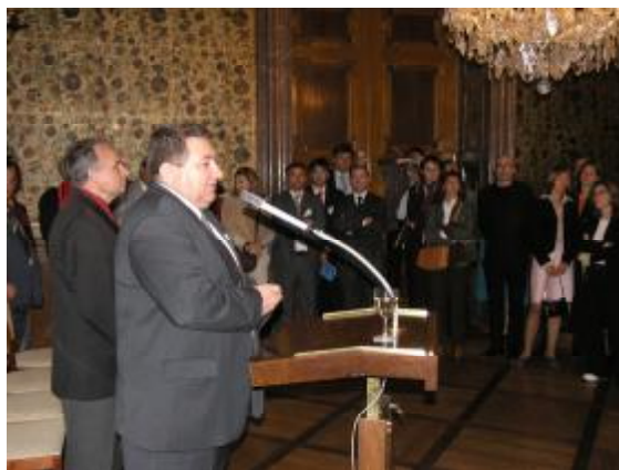
Setkání v Senátu