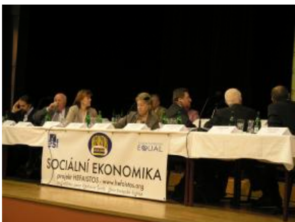
Delegace partnerů z chorvatské republiky