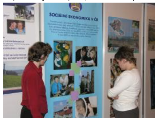
Prezentační výstavka národních partnerů