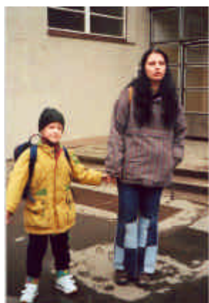
Osobní asistenti ORFEA, kteří

Foto prostoru, pláže a popis viz www.orfeus-cr.cz